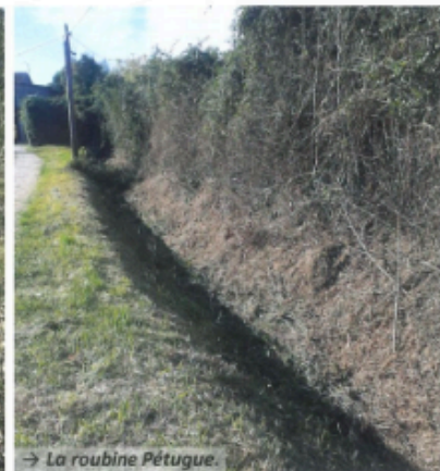
→ La roubine Pétugue.

Les équipes de l'Insertion pour l'emploi (IE13) poursuivent leurs missions afin d'assurer le débroussaillage de la ceinture verte du village, ainsi que l'entretien des ruisseaux et roubines de la commune. Ces actions effectuées plusieurs fois par an, permettent de protéger contre les incendies, de prévenir des inondations, et de mettre en valeur le patrimoine. Ils sont notamment intervenus sur la roubine de Pétugue, le ruisseau du Pouran au niveau du Pas de l'Étroit et dans les oliveraies communales, situées dans les restanques sous le château.