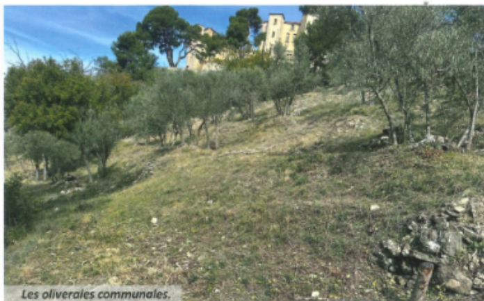
Les oliveraies communales.